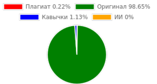
Диаграмма соотношения частей: